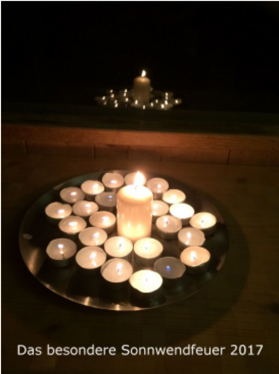
Das besondere Sonnwendfeuer 2017