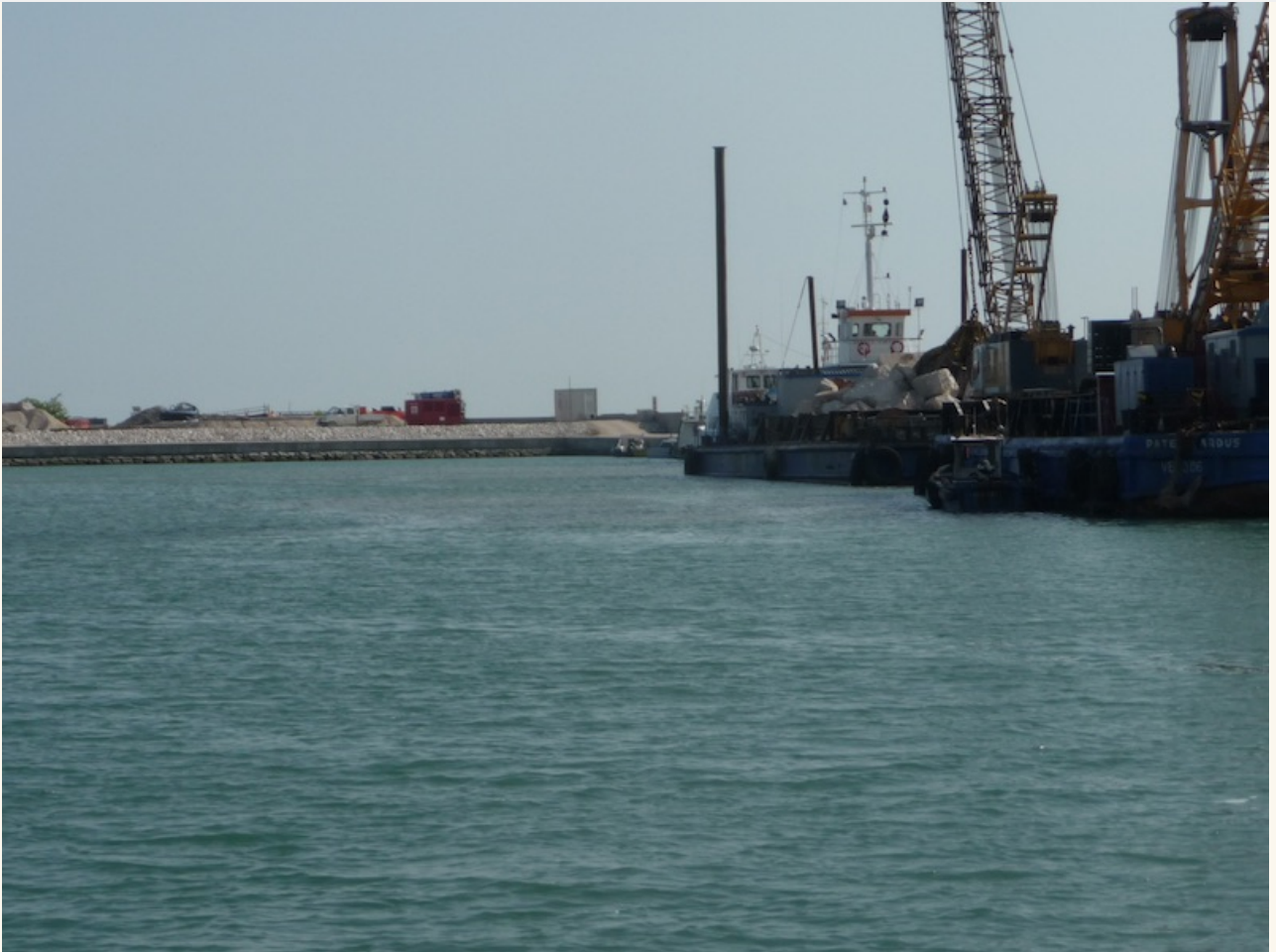
Riesige Schwimmkräne arbeiten an der Aufschüttung der Schutzdämme .