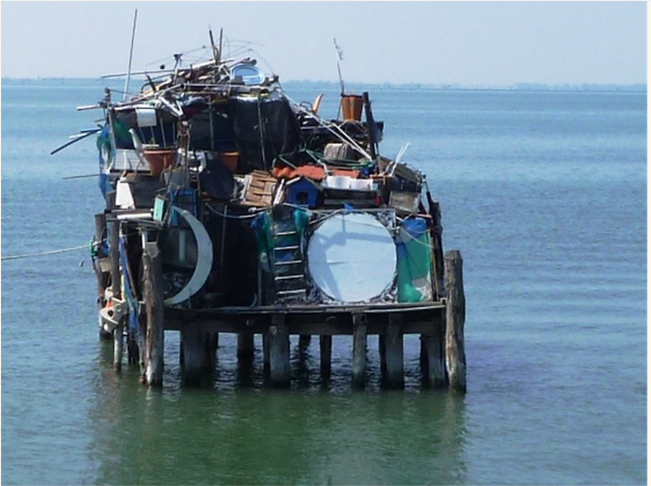
Stilleben in der Lagune von Venedig... im Schatten des Jahrhundertprojekts: High and old tech!