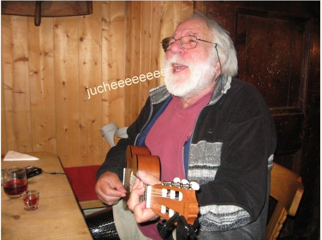
Des Fürsten Herz springt in die Höh... Klingt so herzlich sein Jucheee!