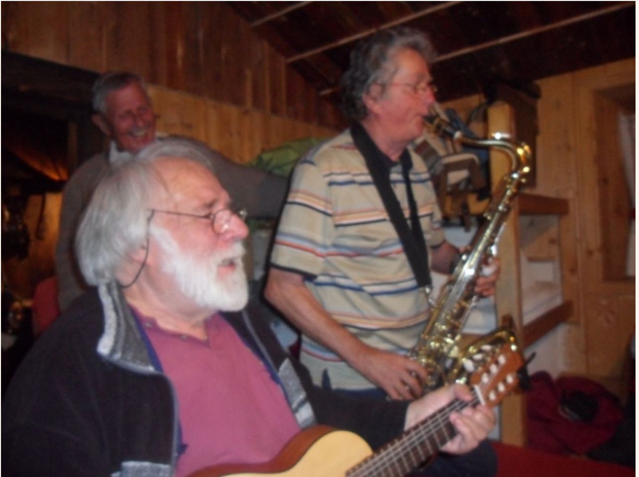
VIB Jul und VIB Sax zur selben Stund Machen Musik im Hintergrund