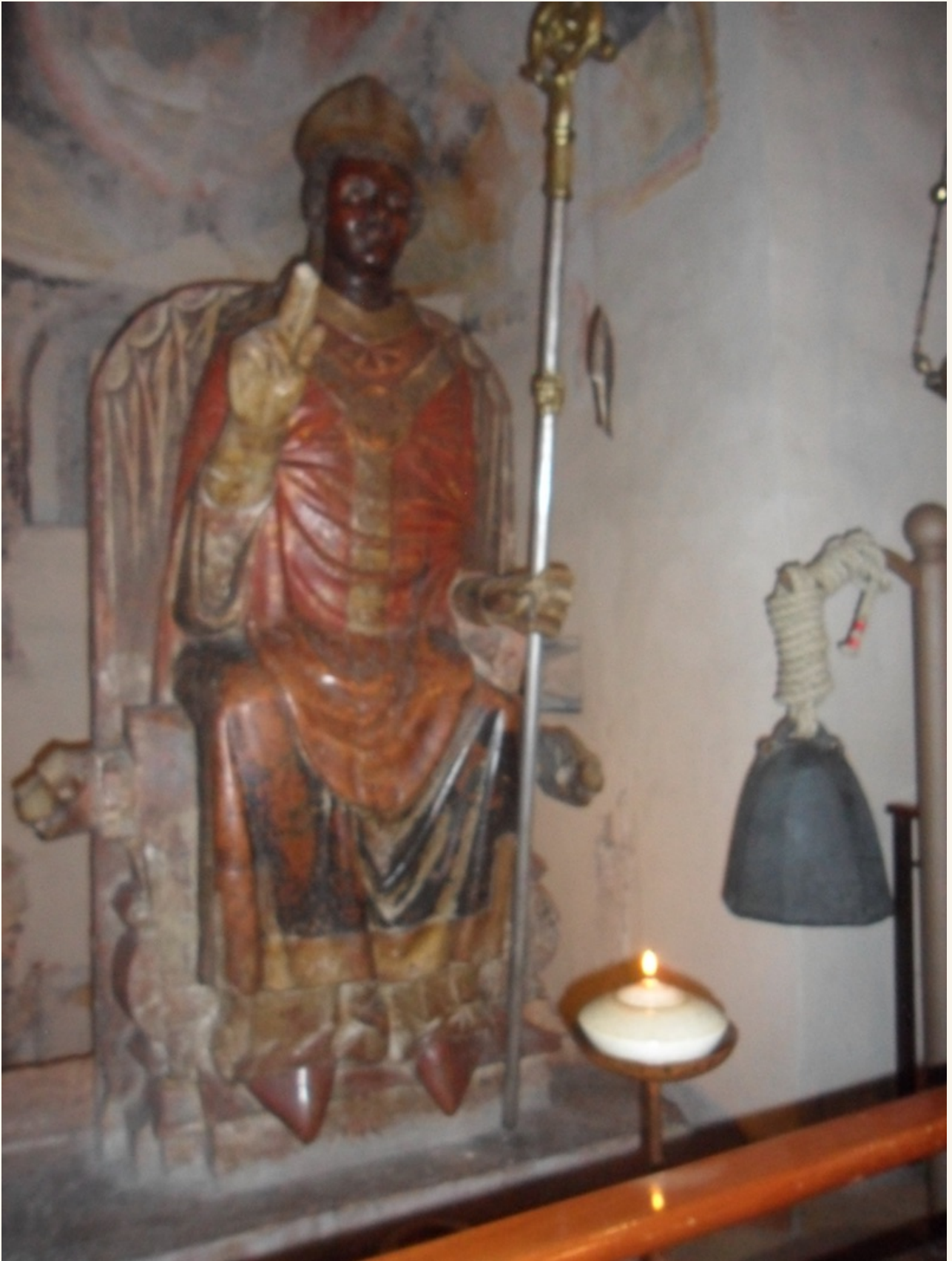
Nach dem Essen waren wir da In romanischer Basilika Da winkt' Sankt Zen von ob herab Uns heim mit seinem krummen Stab.